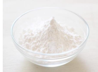
cotta 菓子用米粉 ミズホチカラ 1kg

USS製法で作った低脂肪豆乳が主原料で、動物性由来原料不使用のクリームチーズのような素材。