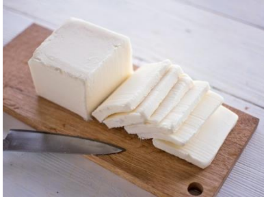
冷凍 不二製油 ソイレブール 有塩 500g

cotta tomorrowでは、以前より多かった「アレルギーの子どもにおやつを作ってあげたい」「毎日の食事に健康的な食材を取り入れてみたい」というお客さまの声にお応えし、カラダにやさしい植物由来の食材を中心とした、プラントベースやグルテンフリーなどのお菓子や料理素材を販売します。