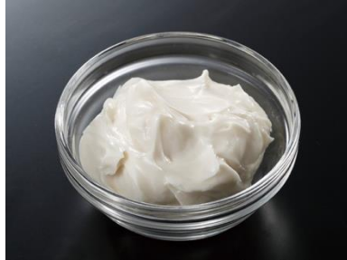
冷蔵 不二製油 マメマージュ 500g

世界初の特許製法で作られた豆乳クリームを使用し、バターのように仕上げたソイレブール。